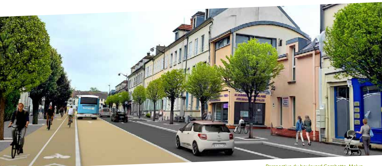
Perspective du boulevard Gambetta, Melun - Intentions d'aménagements

Les accès (riverains, parking Indigo, commerces, etc.) seront également maintenus sur toute la durée des interventions.