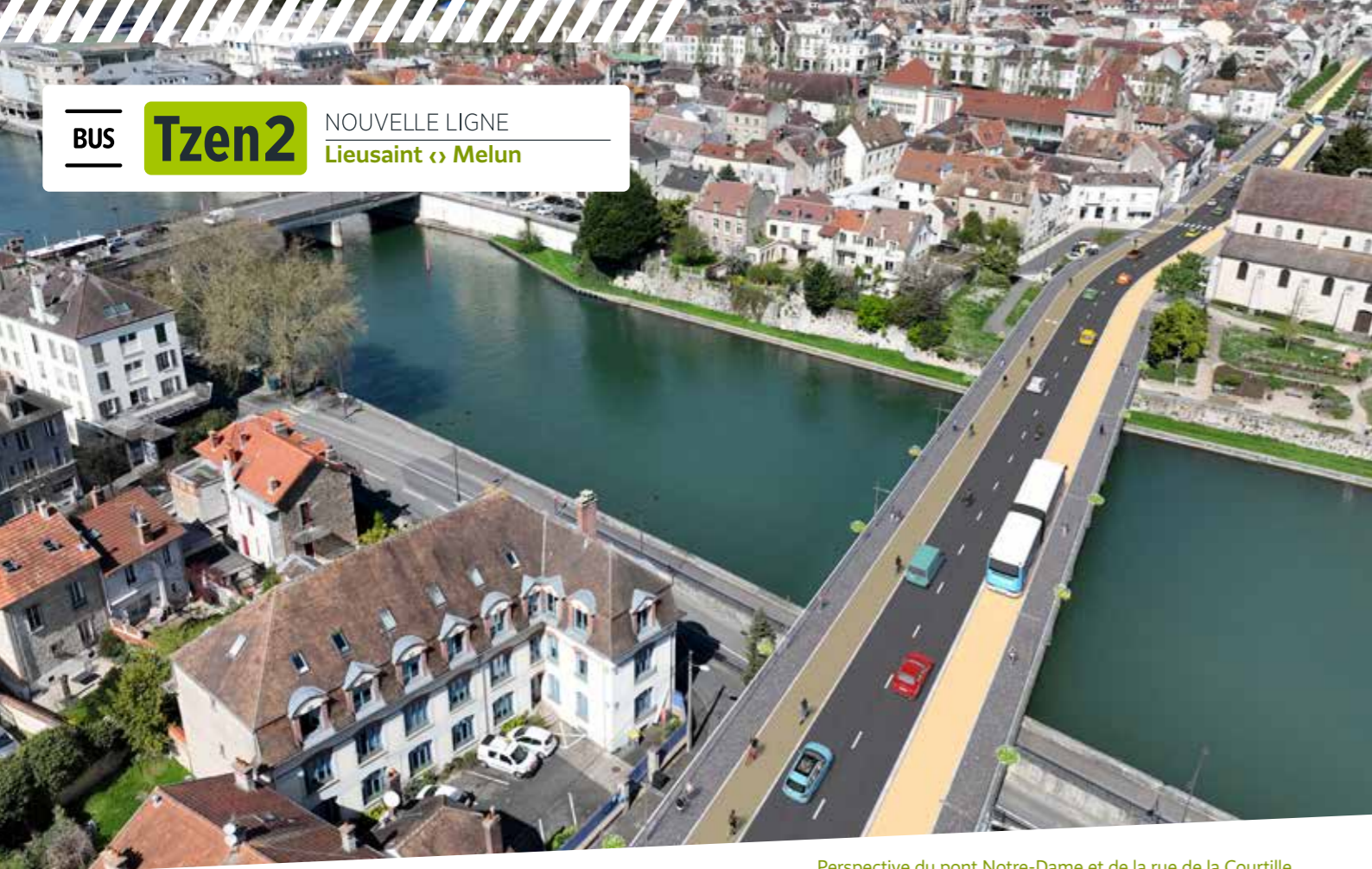
Perspective du pont Notre-Dame et de la rue de la Courtille, Melun - Intentions d'aménagements